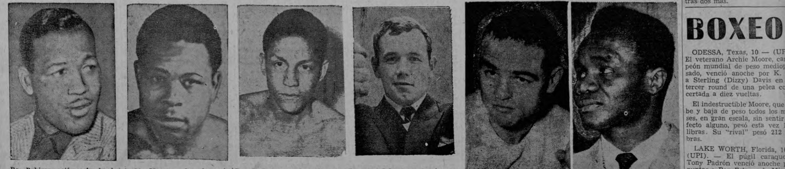
Ray Robinson está acostumbrado a pelear una vez al año Archie Moore, a los cincuenta años es de energías inagotables Don Jordan, campeón welter recién togado venció a Gutiérrez Ingemar Johansson, fuerte aspirante al título de Patterson. Alfonso Halimi, el circo interrumpió su carrera pero volvió Hogan "Kid" Bassey, el conservador, le amenaza Davey Moore

Con la supresión de la I. B. C. que los protegía, ahora se ven obligados por la Comisión Mundial, a exponer su cetro cada seis meses.